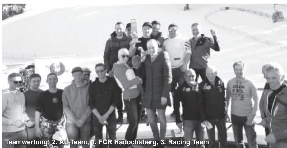
Teamwertung: 2. AU-Team, 1. FCR Radochsberg, 3. Racing Team